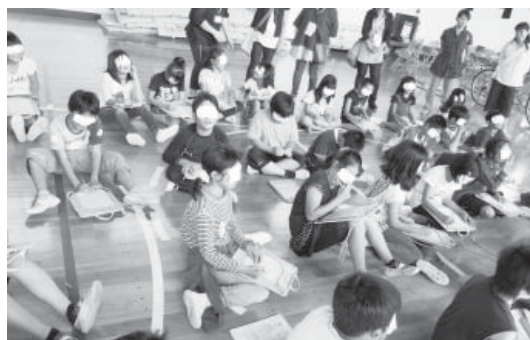
▲ 目隠して先生の顔を書いてみると…?

ボランティアセンターでは江戸川区福祉ボランティア団体協議会活動部会と協力して「出前ボランティア体験」事業を実施しています。