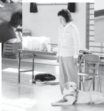
◀ 盲導犬っておとなしいね

出前ボランティア体験は、障害のある方とボランティアさんが学校等に出向き、障害のある方のお話や、車いす・ガイドヘルプ（視覚障害体験）・点字・手話の体験をしていただくプログラムです。こうした体験を通じて、身の回りで自分の出来ることに気づき、人を思いやるボランティアの心をはぐくんでほしいと願っています。