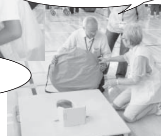
簡易トイレの設置