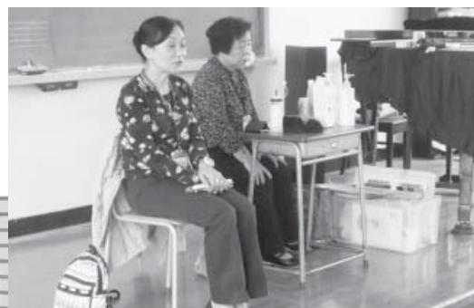
▲ 障害者の日常生活のお話