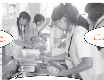
松江三中で炊き出し