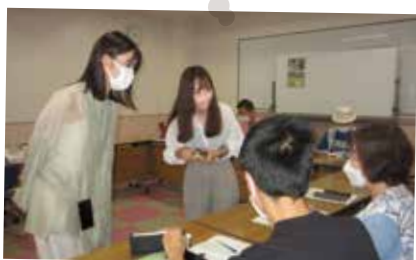
ボランティア団体「江戸川にほんごクラブ」での夏ボラ体験

夏休み(7月20日～8月31日)を利用して、ボランティア活動を体験する「夏のボランティア体験」。今年も保育園や図書館、高齢者・障害者などの施設、すすくスクール、ボランティア団体にご協力いただき開催しました。