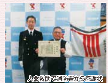
人命救助で消防署から感謝状