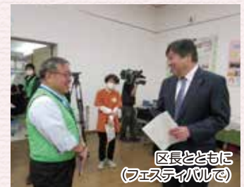
区長とともに (フェスティバルで)