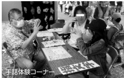
手話体験コーナー