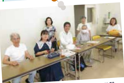
ボランティア団体「布絵の会」で夏ボラ体験