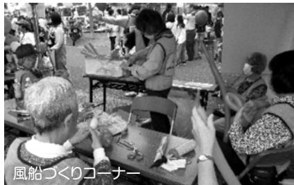
風船づくりコーナー