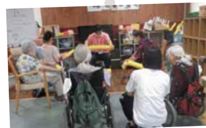
特別養護老人ホーム「アゼリー-江戸川」での夏ボラ体験