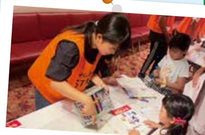
イベントでの夏ボラ体験