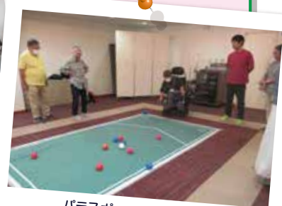
パラスポーツボッチャ体験