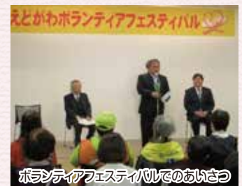
ボランティアフェスティバルでのあいさつ