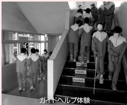
ガイドヘルプ体験