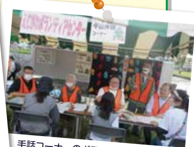
手話コーナーのボランティアの皆さん