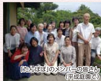
「たんぽぽ」のメンバーの皆さん (平成庭園で)

平成16年からは、「なぎさ☆キッチン」(子ども食堂)を「たんぽぽ」のメンバーと他団体のメンバーが協力して、なぎさ和楽苑で手作りの夕食弁当を100個くらい作っています。お子さんは100円、大人は300円いただいています。皆さんにたいへん喜んでもらっていて、メンバーも献立から考えて手作りすることにやり甲斐を感じています。