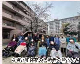
なぎさ和楽苑の入所者の皆さんと

これからも自分のできることは継続したいのですが、ボランティアの高齢化に対しては、若い世代のボランティアの育成が益々重要だと考えています。