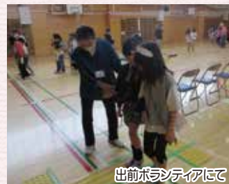
出前ボランティアにて

小・中学校の「総合学習の時間」に向向くのですが、児童・生徒の皆さんが生き生きとして体験する姿を見て、私も活力をもらっています。