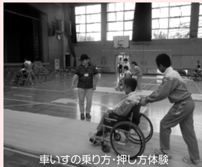
車いすの乗り方・押し方体験