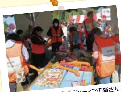
バルーンコーナーのボランティアの皆さん

「バルーンコーナー」は行列ができ盛況でした。「手話体験コーナー」も小さいお子さんから熟年者まで多くの皆さんでにぎわいました。ボランティア及びご来場の皆様ありがとうございました。