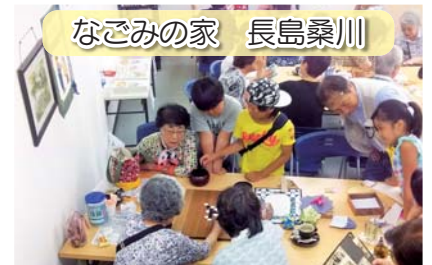
なごみの家 長島桑川