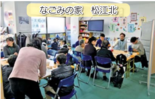
なごみの家 松江北