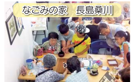
なごみの家 長島桑川