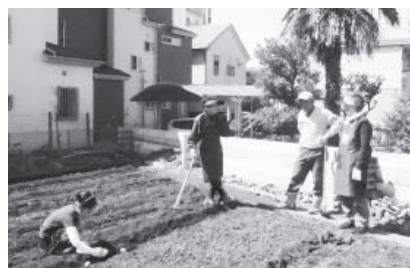
〈ジャガイモを蒔きました〉

秋の収穫時のイベントを楽しみに、畑にまく種は、ジャガイモ・人参・かぼちゃ・・・ 収穫の夢は膨らみます。 今後は水撒きや草むしりなどで忙しくなりそうです。