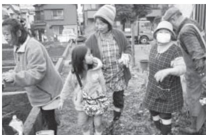
〈雨の中草むしりお疲れ様〉