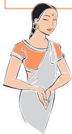
インドのサリーと ヘナの体験

子どもも大人も、障害のある方も外国の方も、誰もが楽しめる交流広場です。 昔懐かしいけん玉で、小学生名人に挑戦! 動物ふうせんを作ったり、太鼓をたたいてみたり楽しいことが満載です。